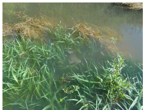
Laichwiese mit Brachse

Am südlichen Ufer des Altarms wird eine große Flachwasserzone angelegt, die ideale Laichmöglichkeiten für Krautlaicher bieten soll. Im gesamten Stauraum Greifenstein sind solche Stellen rar, diese Maßnahme wird sich also auch auf die Donau selbst positiv auswirken. Da der Wasserspiegel im Altarm zukünftig weitgehend konstant