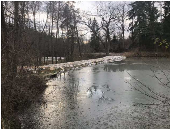
Neue Überlaufmulde und Überfahrt

Es gab sie schon, bevor es Bewilligungen gab, sie überstanden schadlos das Hochwasser 2002. Die Wasserrechtsbehörde kennt trotzdem kein Pardon: Eine anonyme Anzeige führte dazu, dass wir für unsere uralten Teiche im Kohlbach um eine Bewilligung ansuchen mussten, so als würden wir sie neu bauen.